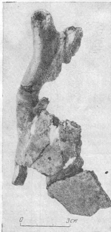
Рис. 2. Фрагменты сосуда с зооморфной ручкой

и фигурками животных и среди находок в Нижнем Поволжье, главным образом в позднесарматских погребениях Бережновского могильника (курган 13, 76), в курганах Бичкин-Булук и других местах 7 и связываются