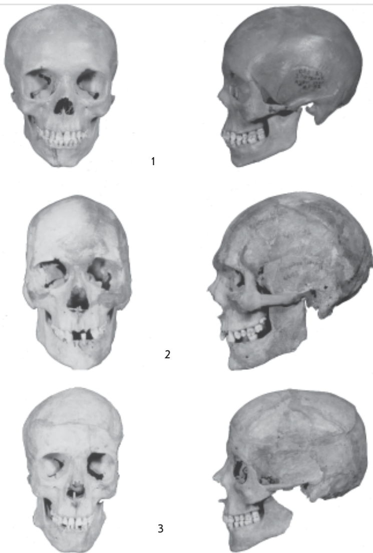
Рис.4. Черепа потаповского культурного типа памятников (1) и срубной культуры (2,3).

1 - женский, умеренно уплощенный, мезо-брахикранный уралоидный тип (Потаповка I, к.5, п.2, Самарская обл.); 2 - мужской, высоколицый, резкопрофилированный, южноевропейский тип (Спиридоновка II, к.2, п.37, Самарская обл.); 3 - мужской, узколицый, долихокранный, с уралоидной примесью (Спиридоновка II, к.1, п.1, Самарская обл.).