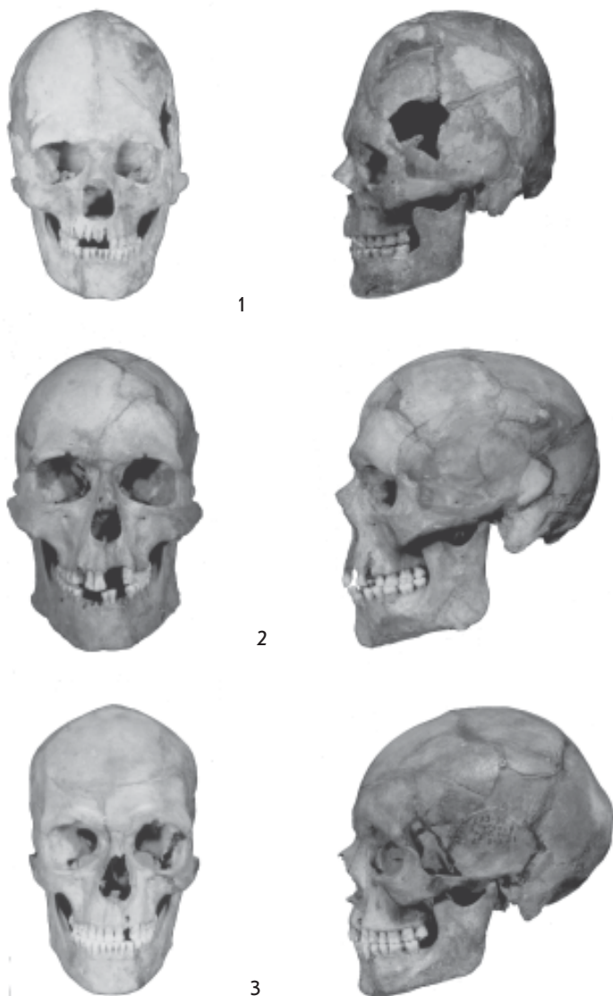
Рис.3. Черепа ямно-полтавкинского времени (1) и потаповского культурного типа памятников (2, 3).

1 - женский, европеоидный, искусственная деформация (Нурский I, п.5); 2 - мужской, гиперморфный, мезо-долихокранный европеоидный тип (Потаповка I, к.5, п.8, Самарская обл.); 3 - мужской, узколицый, долихокранный европеоидный тип (Потаповка I, к.5, п.13, ск.1, Самарская обл.).