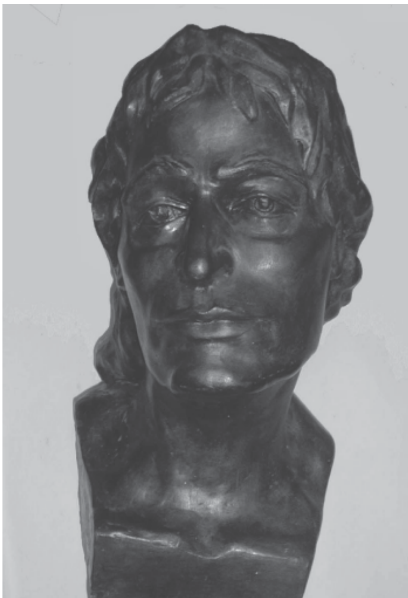
Рис.6. Скульптурная реконструкция лица по черепу. Мужчина срубной культуры (мог. Лузановский, Самарская обл.). Выполнена Л.Т.Яблонским.